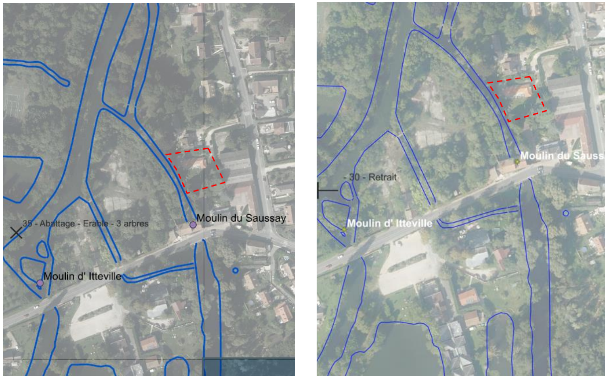
Cartographies issues du PPE hivernal (à gauche) et estival (à droite) 2023

Selon lui les arbres sont en mauvais état et penchés au-dessus de sa maison (un arbre est tombé en 2022 sur sa maison occasionnant quelques dommages). Suite à ces observations, une attention particulière a été portée sur ce bief lors des campagnes d'entretien estivale et hivernale de 2022 et 2023. Les diagnostics n'ont révélé rien d'anormal.