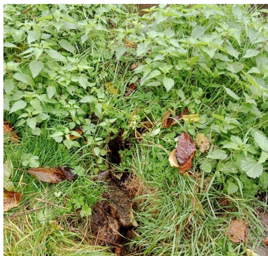
Photographies des renards hydrauliques prises lors d'une visite de terrain par les agents du SIARCE (23.10.2023)