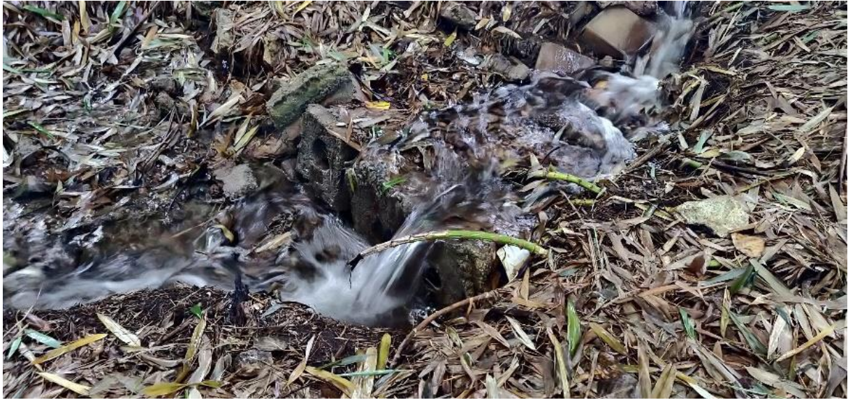
Photographie du renard hydraulique chez M. Cordonnier

Aujourd'hui l'eau s'échappe en quantité importante en contrebas du ru.