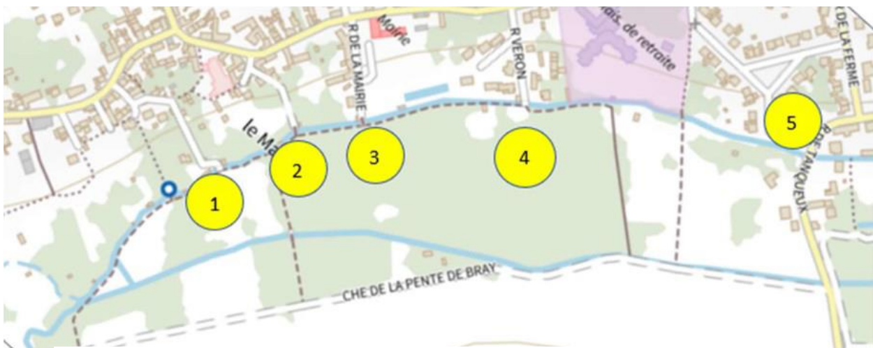
Recensements des zones d'envasements