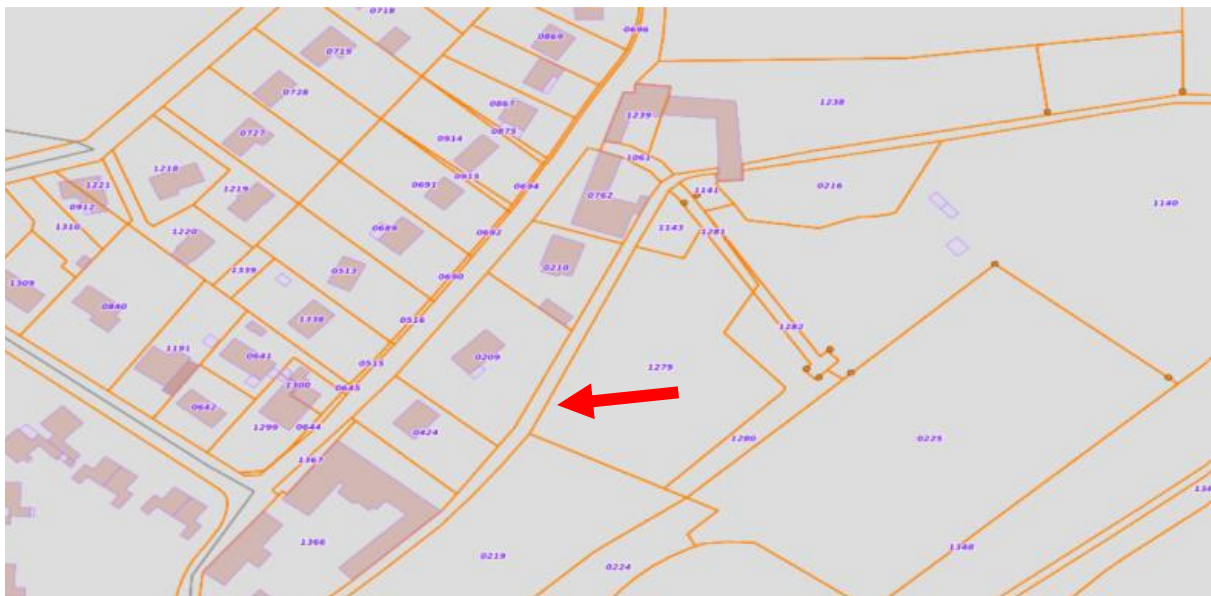
Cartographie parcellaire du Moulin Tanqueux

Cette renarde avait été traitée à l'initiative du SIARCE par des travaux ponctuels de renforcement de berge et d'étanchéité par le SIARCE (banquette à hélrophytes) durant les travaux d'ensemble de 2010 de remise en état du RU. Mais sans efficacité à moyen terme.